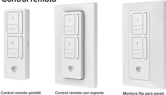
Control remoto portátil